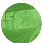
Gare - Quais CFF