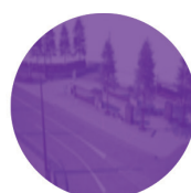
Boulevard de la Forêt