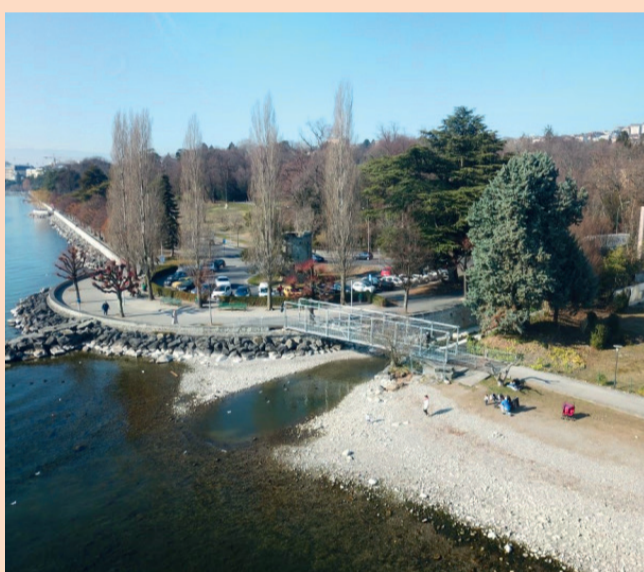
Vue aérienne de la passerelle provisoire de la Vuachère