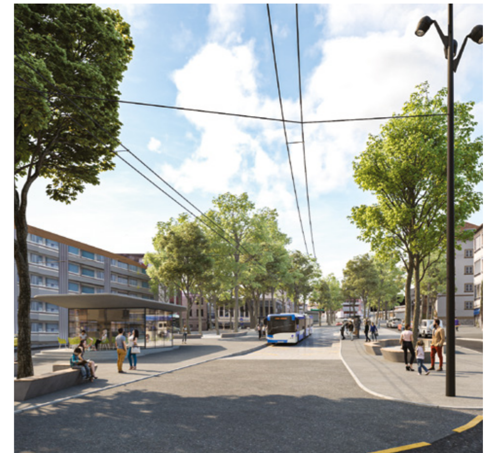
Futurs aménagements, Place de la Clergère

Des bus confortables, climatisés et avec plus de capacité