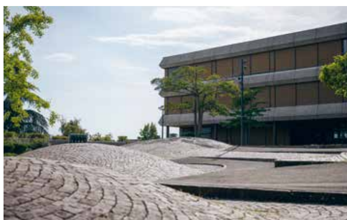
Centrale de chauffe du gymnase de Burier à la Tour-de-Peilz, similaire à celui imaginé à Pully (à gauche)