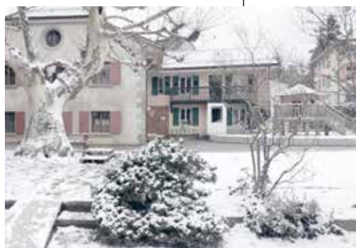
Bâtiment actuel dans le Parc Guillemin et plan de la réalisation future

Consciente de la difficulté pour de nombreuses familles de trouver une place d'accueil pour leurs enfants jusqu'à l'âge d'entrée à l'école, la Municipalité souhaite orienter son action sur le développement de places en nurserie et garderie. Deux projets de nouvelles nurseries/garderies sont ainsi en cours d'étude :