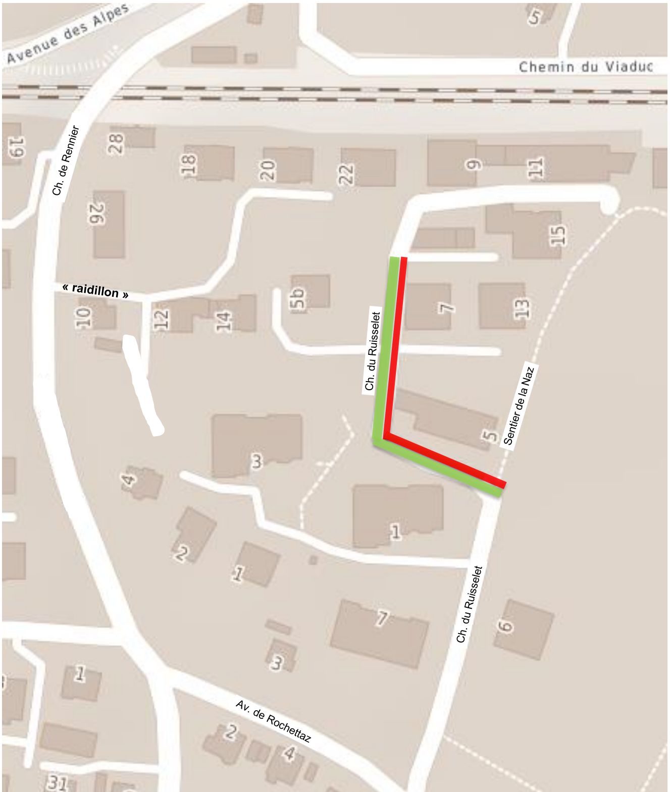
Plan de situation du quartier du Ruisselet