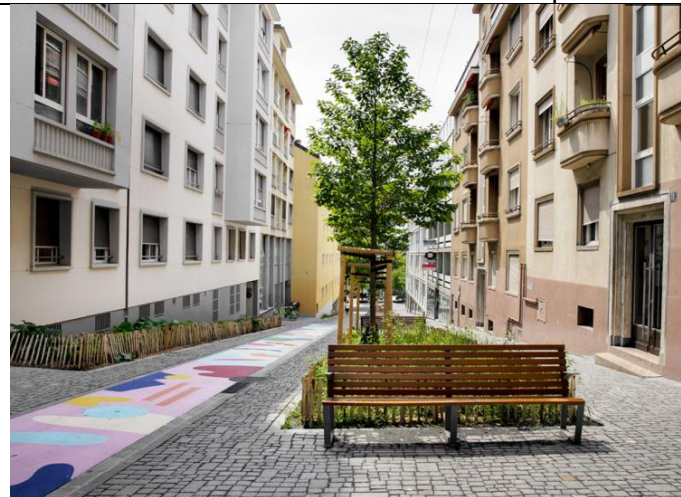
Lausanne, rue Pré-du-Marché Bande de circulation lisse dans une zone pavée