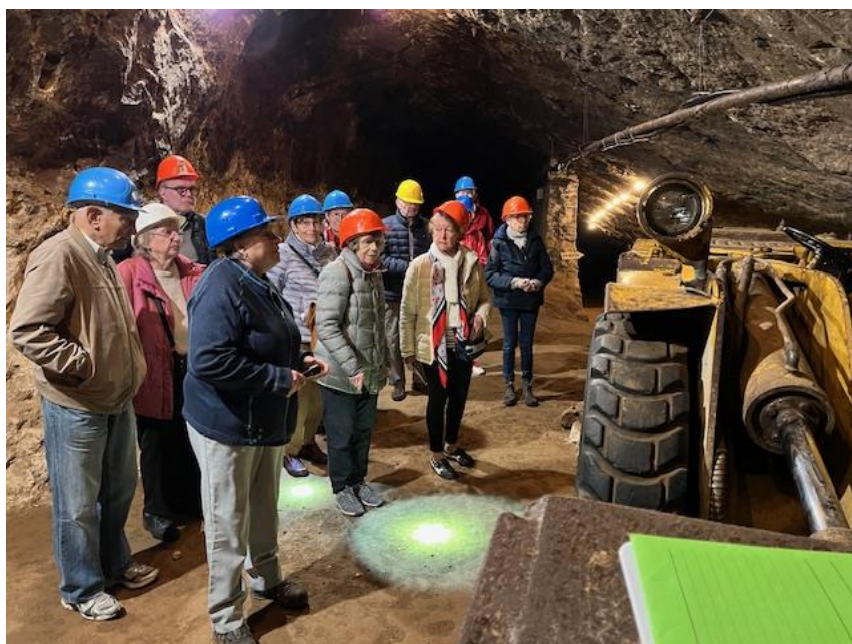
Un public très attentif

Coiffés d'un casque de chantier et munis d'une lampe torche, nous cheminons entre une paroi de roche calcaire et une paroi d'asphalte. À 2 endroits de la galerie, une vidéo nous montre le travail des mineurs, qui pouvaient être jusqu'à 120 sur place, leur repas dans la mine interrompant des journées