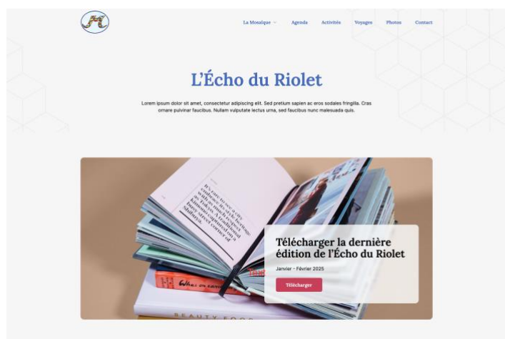
Maquette d'une page du futur site internet