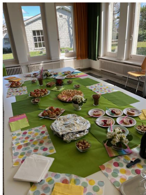
La table du goûter-apéritif

John Hislair remercie l'assistance et en particulier les orateurs puis invite l'assemblée à se déplacer vers la table du goûter-apéritif, dont s'échappait, depuis un moment déjà, un fumet appétissant. Cette partie récréative et gustative est toujours l'occasion d'échanges informels et amicaux très appréciés !