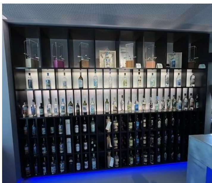
Présentoir de bouteilles d'absinthe

Notre sympathique guide, Gaby, évoque alors certaines anecdotes croustillantes de ces gens qui, au nez et à la barbe de la justice, ont joué un rôle majeur dans le maintien des traditions locales.