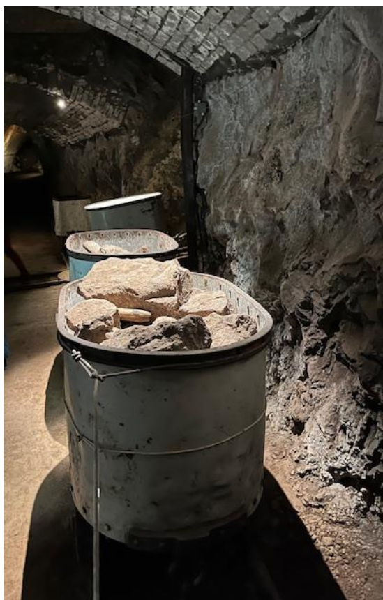
Un wagonnet d'époque

souvent rythmées par la cadence des « 3-8 », l'extraction de la roche et le remplissage des wagonnets (autrefois tirés par un cheval). Il a bien été précisé, qu'aucune femme, ni enfant ne travaillèrent dans ces tunnels dont la température constante est de 8 degrés.