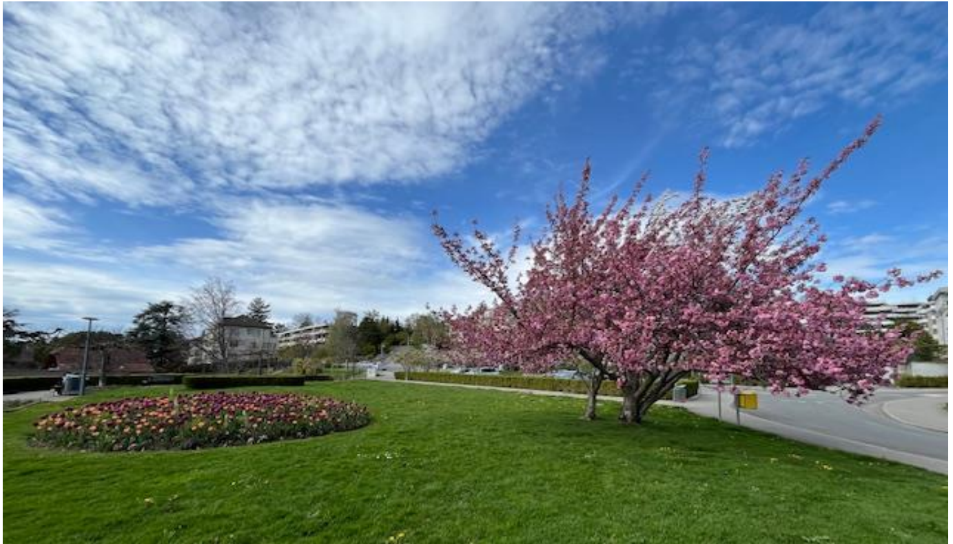
Début de printemps sur la place Chantemerle.

Bulletin d'information de LA MOSAÏQUE DE PULLY NORD ONZIÈME année, N° 57, Mai-Juin 2024