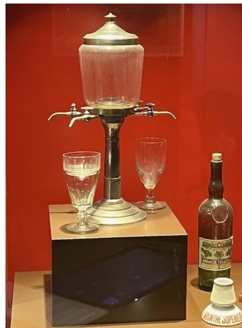
Fontaine à eau

Dès l’antiquité, la plante a été utilisée de façon médicinale, pour traiter maladies et douleurs diverses. Au 19 ème siècle, elle se vulgarise en tant que boisson, telle qu’on la connaît aujourd’hui. Après les heures de gloire, viennent les heures sombres, ponctuées de drames qui conduisent à son interdiction en 1908. Dès lors et jusqu’en 2005, où elle est relégalisée, elle entre en clandestinité.