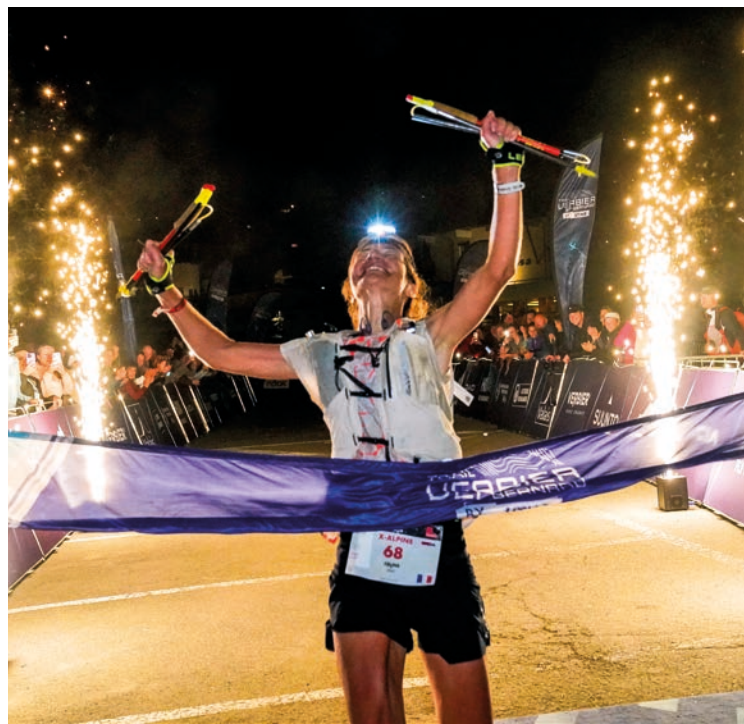
Sur la ligne d'arrivée à Verbier