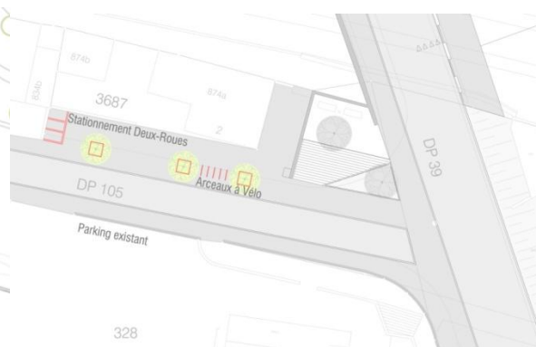
Nouveau projet de la Municipalité

L'objectif est d'aménager le trottoir Nord-Est de l'av. des Collèges (à la hauteur du n°2) afin d'éviter le stationnement sauvage. Les modifications apportées sont les suivantes :