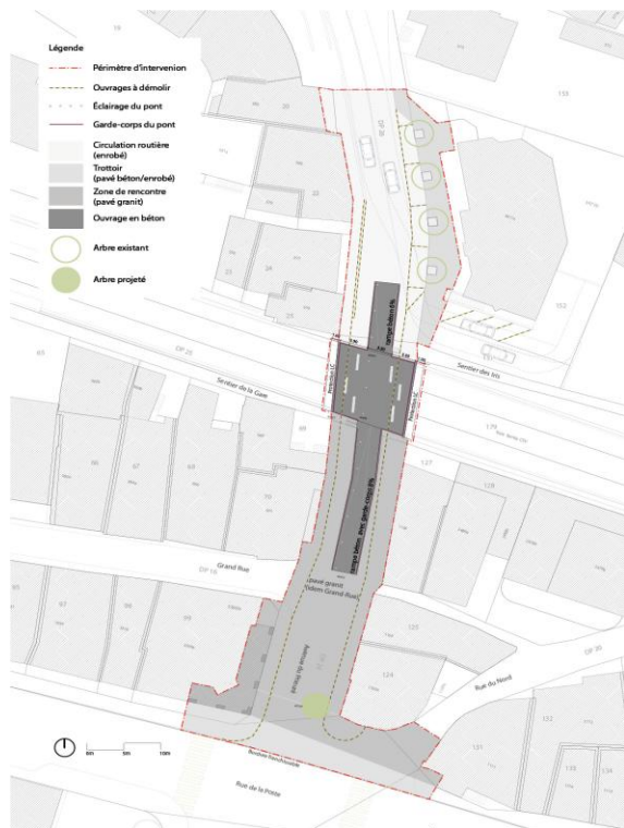
Extrait du plan présenté dans le préavis n°01-2012