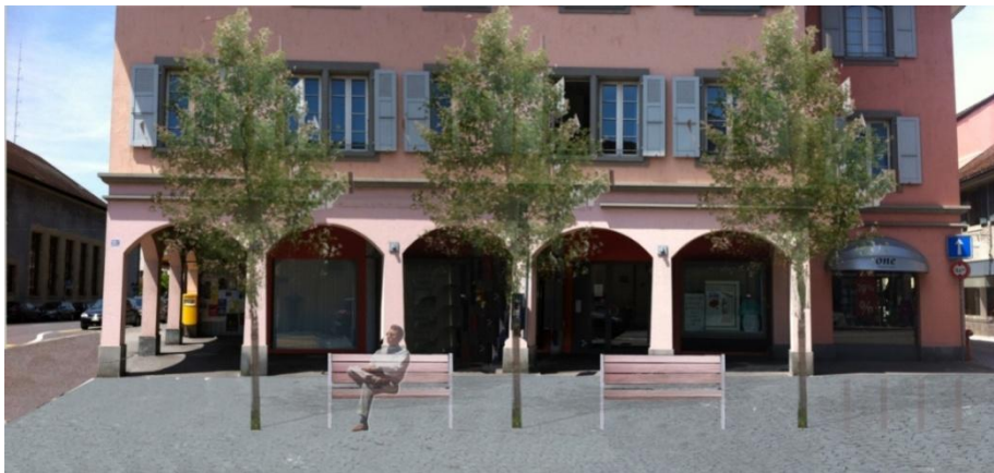
Nouveau projet de la Municipalité

Les modifications apportées sont les suivantes :