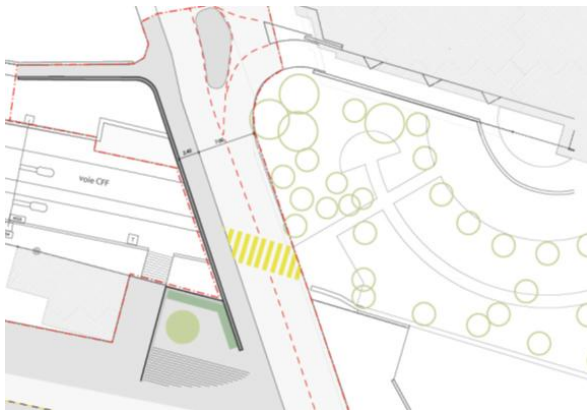
Extrait du plan présenté dans le préavis n°01-2012