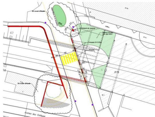
Nouveau projet de la Municipalité

Les modifications apportées sont les suivantes :