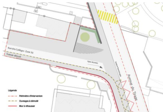
Extrait du plan présenté dans le préavis n°01-2012