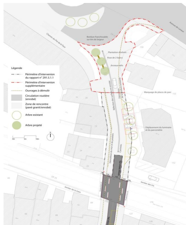
Nouveau projet de la Municipalité

Une enquête publique type CAMAC s'est déroulée du 28 novembre 2012 au 7 janvier 2013 en vue d'étendre le périmètre des travaux au Nord du Prieuré. Celle-ci n'a fait l'objet d'aucune opposition.