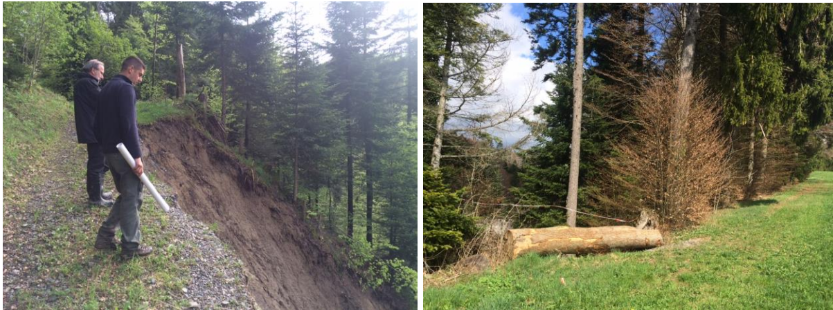
Glissement et mesures de protection au ch. du Bois du Moulin

A la suite des abondantes intempéries du début du mois de mai 2015, un glissement de terrain a eu lieu en aval du chemin forestier du Bois du Moulin sur le versant Est de la Chandelar, où une partie de l'encaissement du chemin a été emportée. Ce dernier a été immédiatement fermé à la circulation.