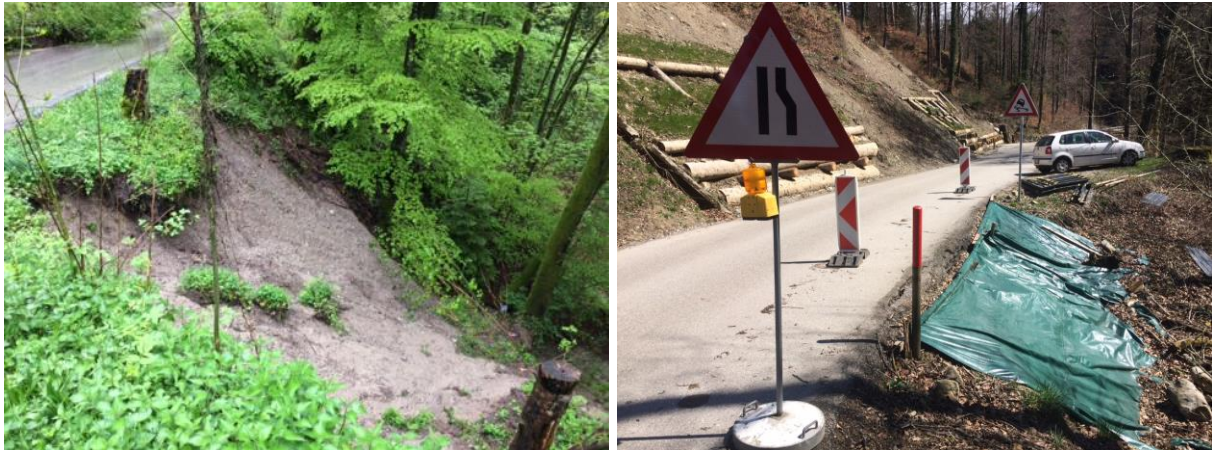
Glissements et mesures de protection au ch. de la Gravière

Deux glissements de terrain dans le talus sis en aval du ch. de la Gravière ont emporté le bord de la chaussée. Les mesures urgentes qui ont été réalisées comprennent le rétrécissement de la voie circulaire pour sécuriser les usagers ainsi que la mise en place d'une bâche protectrice afin de stopper la progression des glissements.