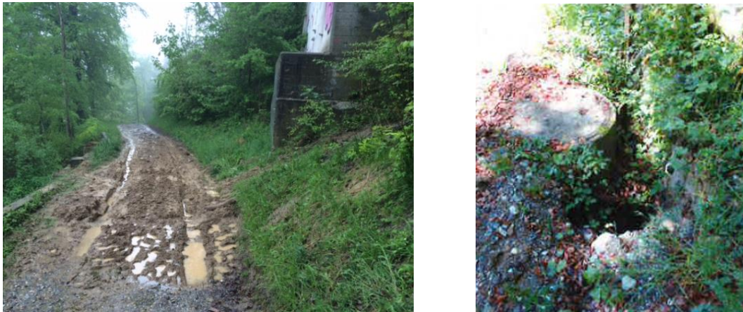
Dégâts constatés au ch. des Raforts après les intempéries

Deux mouvements de terrain ont été observés sur le chemin forestier des Raforts, en amont de son passage sous l'autoroute. Des dégâts ont été constatés sur les dispositifs existants de stabilisation de la route (rails métalliques, caissons en bois ou système de collecte des eaux de ruissellement). Le sentier forestier a été fermé à la circulation et aux promeneurs après les intempéries de mai 2015.