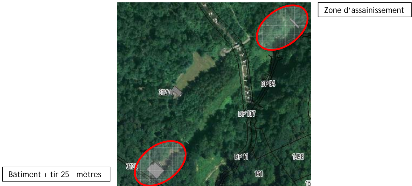
Figure 1 : Plan de situation